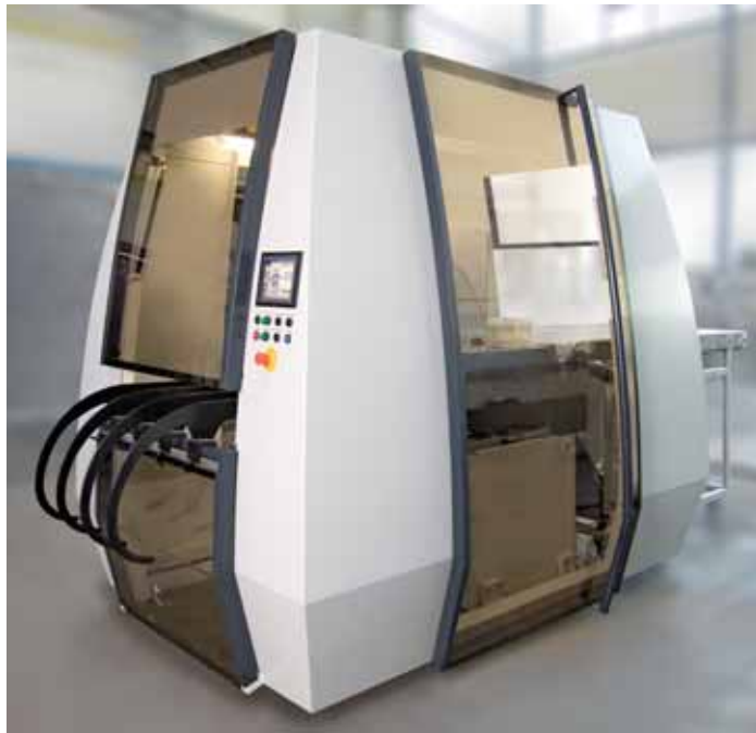
Durchfallschnittstanze Serie KES

Zwei unterschiedliche Baugrößen erlauben individuelle Anwendungen dieser eigenständigen Anlage, die mit jeder Thermoformanlage kombiniert werden kann.